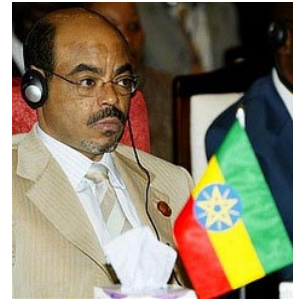
Meles Zenawi, Primer Ministro de del La República Democrática Federal de Etiopía