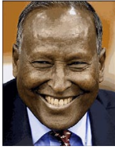
Abdullahi Yusuf, actual Primer Ministro Gobierno de Transición en Somalia

tal. Por lo anterior, el Parlamento de Transición Federal, establece en octubre de 2004 a Abdullahi Yusuf como presidente del Gobierno de Transición Somalí, contando con el apoyo de Estados Unidos y Etiopía; concentrando su poder en la ciudad de Baidoa con el financiamiento etíope. Actualmente su gobierno goza del reconocimiento de la Comunidad Internacional.