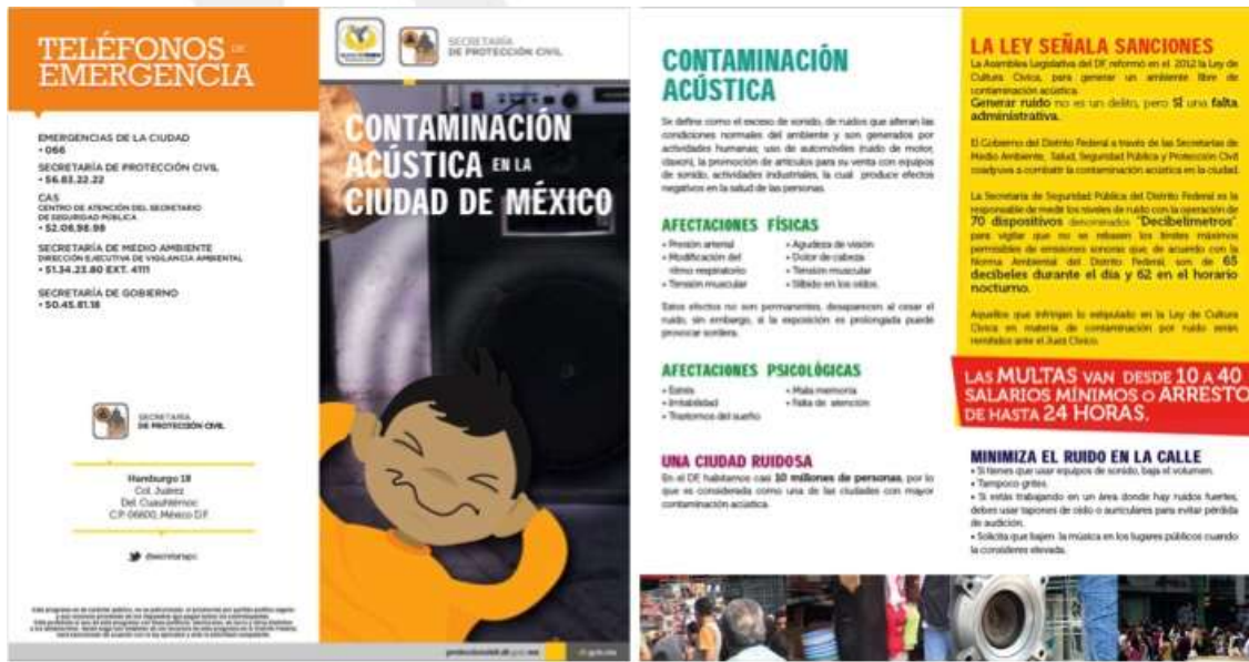
Fig. 2 – Díptico acerca de la contaminación acústica en la ciudad de México.

Este es un paso importante, el GDF declara que la ciudad de México sufre de contaminación acústica y que es una de las más contaminadas. Esto da pie a la necesidad de una mayor información y sobre todo de acciones. El díptico está disponible en el portal de la Secretaría de Protección Civil, al alcance de los ciudadanos que por curiosidad se dirijan a la sección correspondiente. Además se encuentra disponible en algunos comercios de la ciudad. Como se indica, es un paso importante pero solo algunos se enterarán, porque no se trata de una campaña intensiva, hace falta que ésta llegue a los medios masivos de mayor circulación e impacto en la población.