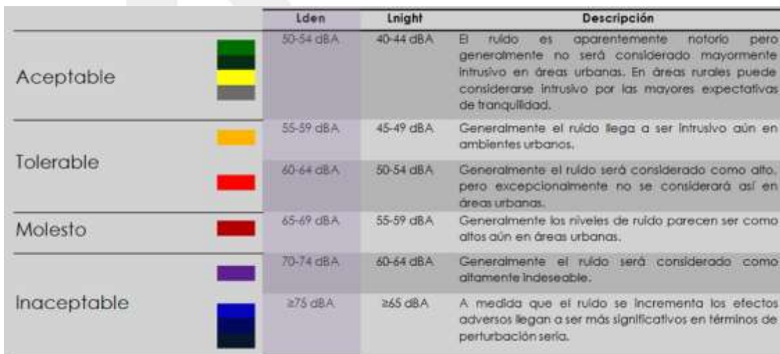
Tabla 2 - Descripción de los efectos de exposición al ruido a varios niveles.

Finalmente una consideración muy importante que del mapa de ruido de la ciudad de México puede hacerse, es que se puede convertir en un vínculo de comunicación entre la población, las autoridades y el problema del ruido, donde además de que queden expresadas las fuentes sonoras clásicas como el ruido por tráfico vehicular o el del ruido de la aviación, puede contener lo que la población percibe y denuncia, haciendo de este instrumento una herramienta viva y cotidiana donde todos puedan visualizarlos.